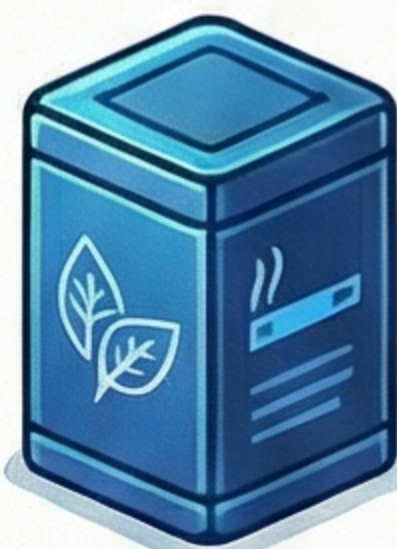
Duvan (Šifra robne marke)